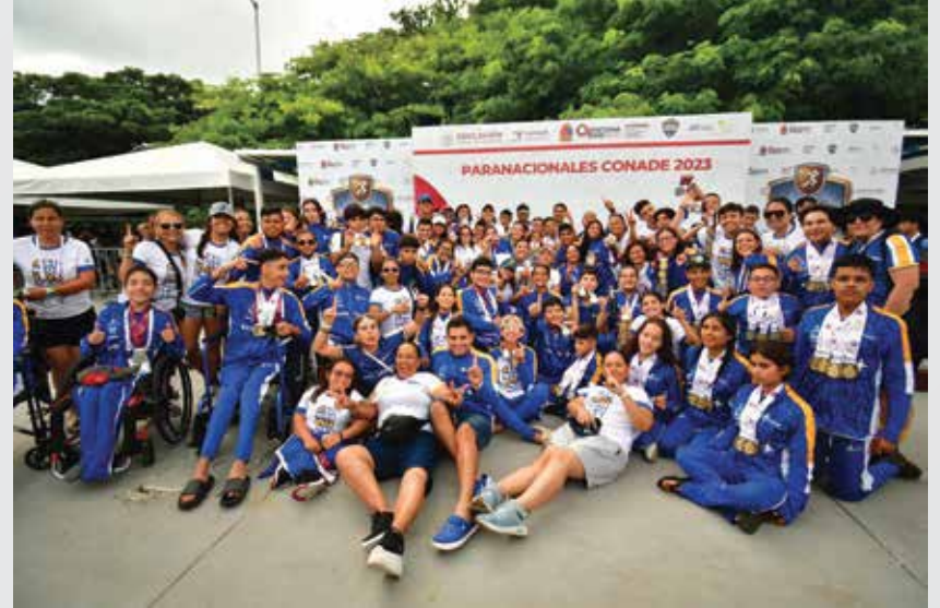
Jalisco conquistó este jueves su primera disciplina dentro de los Paranales CONADE 2023, que se desarrollan en Cancún, Quintana Roo, al ser el estado que más medallas ganó en la para natación, cerrando de forma contundente con 111oros, 54 platas y 33 bronces.